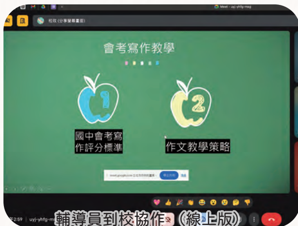
輔導員到校協作 (線上版)