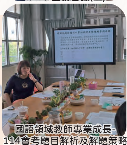
國語領域教師專業成長- 114會考題目解析及解題策略