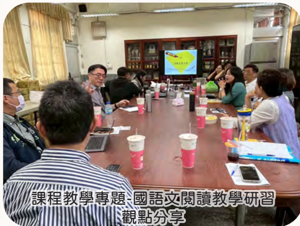
課程教學專題-國語文閱讀教學研習 觀點分享