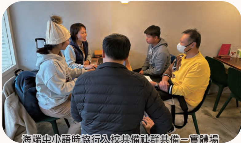
海端中小語時協行入校共備社群共備一實體場