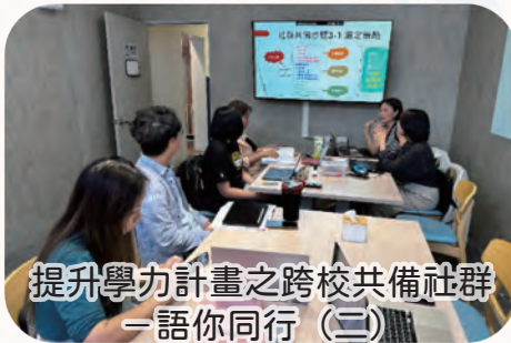
提升學力計畫之跨校共備社群 —語你同行 (二)