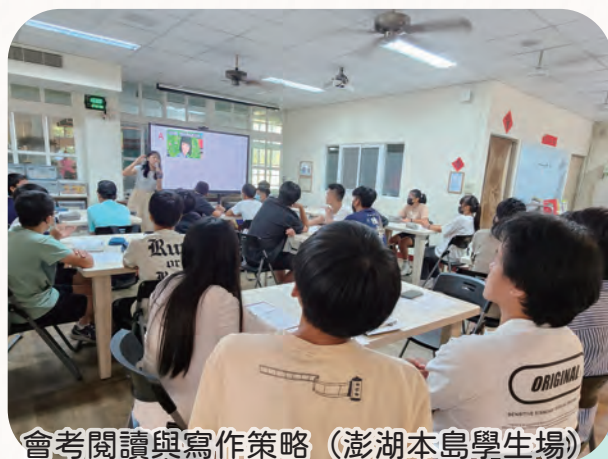
會考閱讀與寫作策略 (澎湖本島學生場)