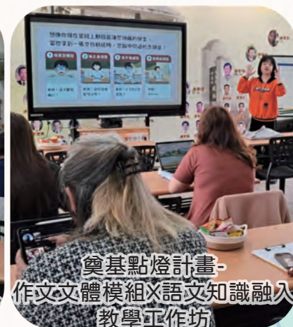
奠基點燈計畫- 作文文體模組X語文知識融入 教學工作坊