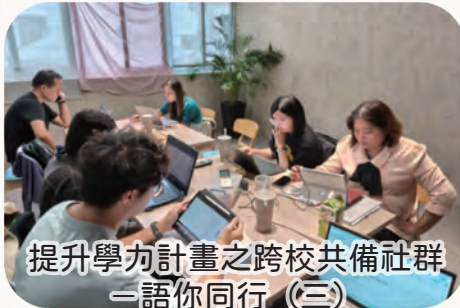
提升學力計畫之跨校共備社群 —語你同行 (三)