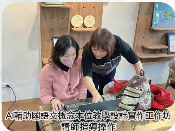
AI輔助國語文概念本位教學設計實作工作坊 講師指導操作