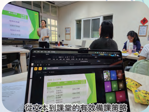
從文本到課堂的有效備課策略