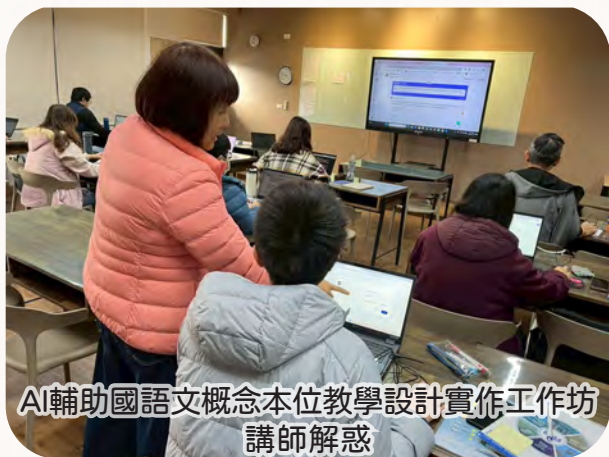
AI輔助國語文概念本位教學設計實作工作坊 講師解惑