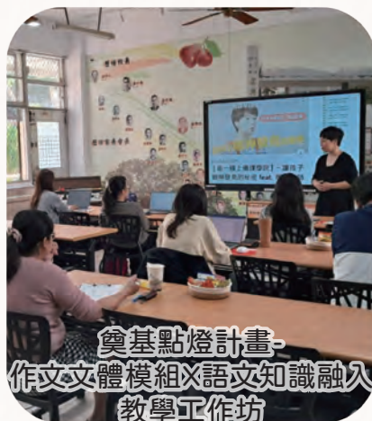
奠基點燈計畫- 作文文體模組X語文知識融入 教學工作坊