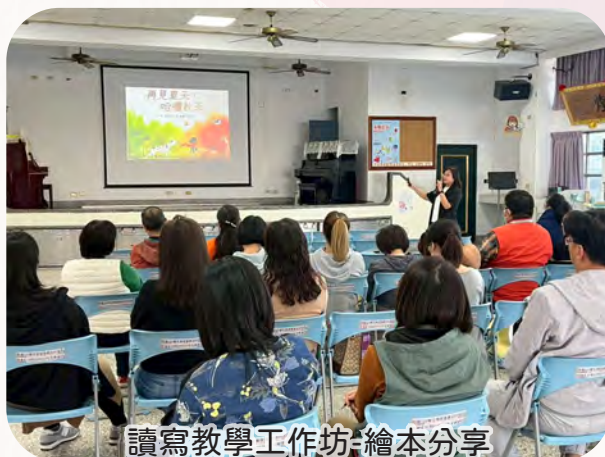
讀寫教學工作坊-繪本分享