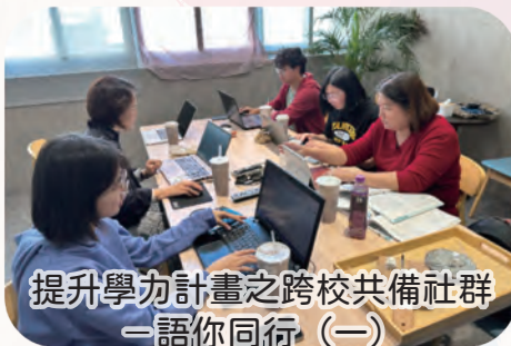
提升學力計畫之跨校共備社群 —語你同行 (一)