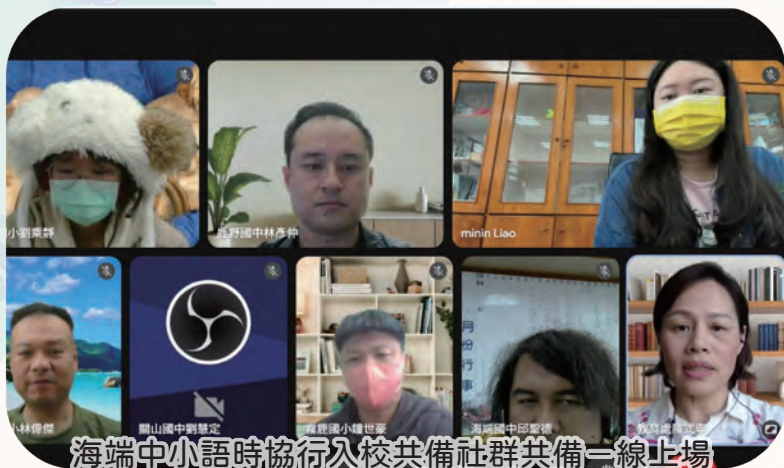
海端中小語時協行入校共備社群共備一線上場