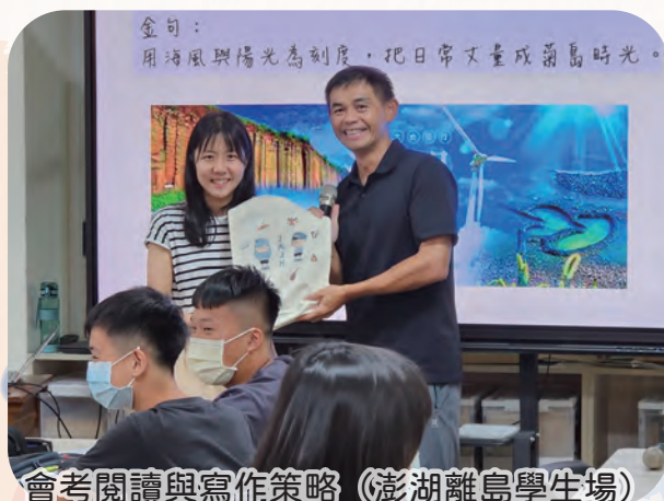
會考閱讀與寫作策略 (澎湖離島學生場)