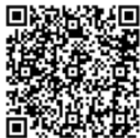
健康食品查詢平台