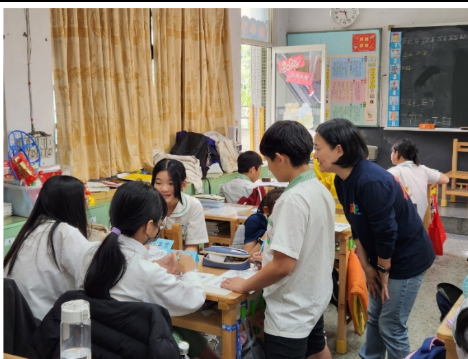
學習單 2 共同討論