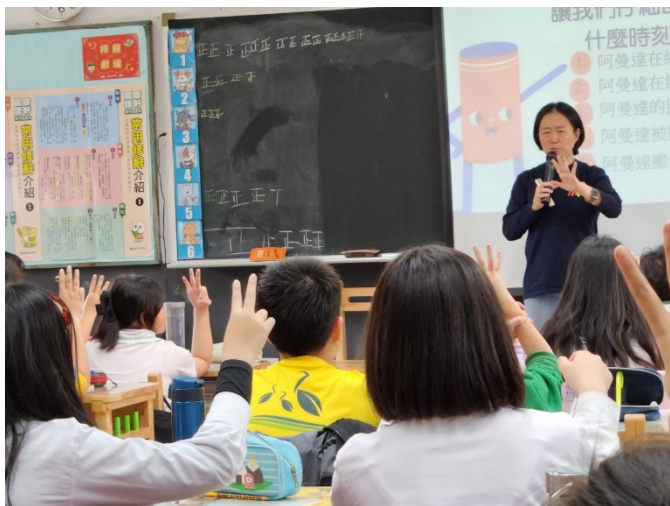
直接以手指表達意見