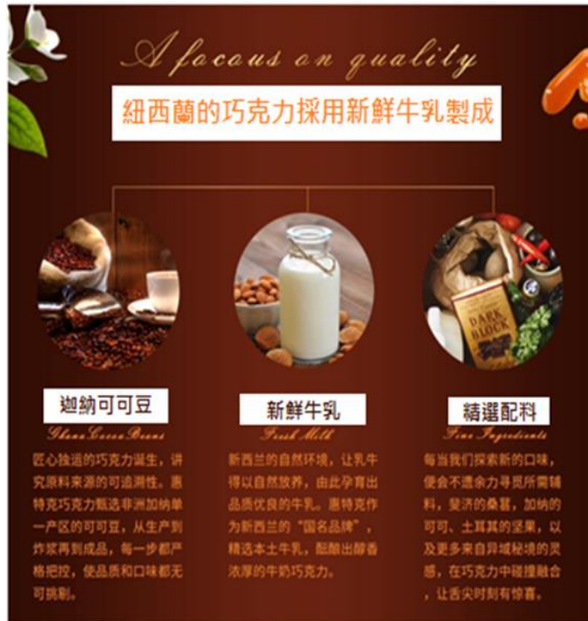
圖片一紐西蘭 Whittaker's 巧克力生產履歷