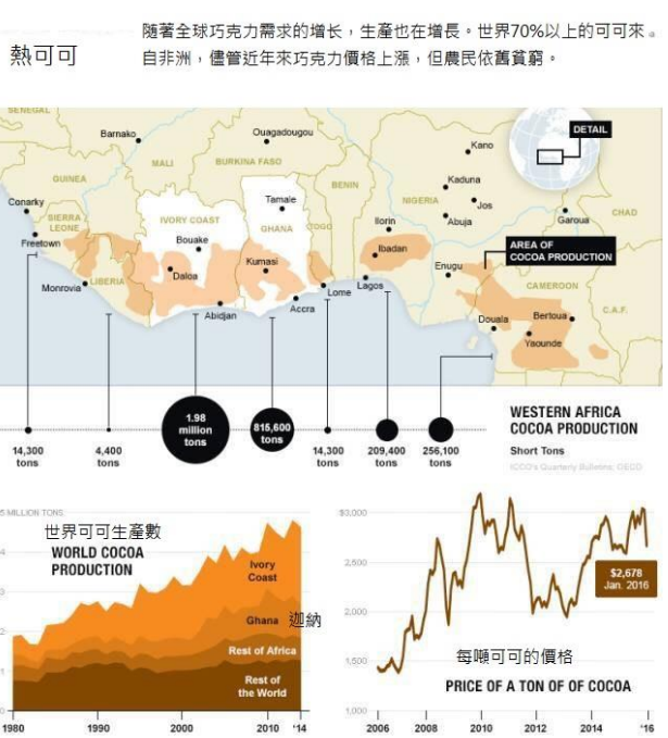
圖片二可可豆產地