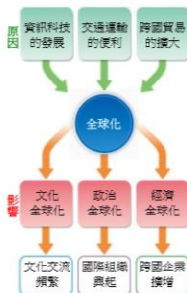
▲圖 3-1-1 全球化的影響層面示例

全球化使得世界似乎成為一個整體的「地球村」，某國發生的事件往往產生跨越國界的影響，形成「牽一髮而動全身」的「全球關連」現象。例如：英國於 2016 年 6 月公民投票決定脫離歐洲聯盟，造成全球股市狂跌，損失約 2.1 兆美元（相當於新臺幣 68.5 兆元）（圖 3-1-2），正是全球關連的最佳寫照。