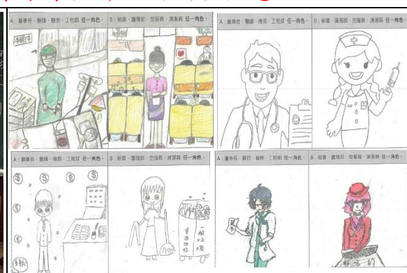
A、B 兩類型職業男女相差懸殊