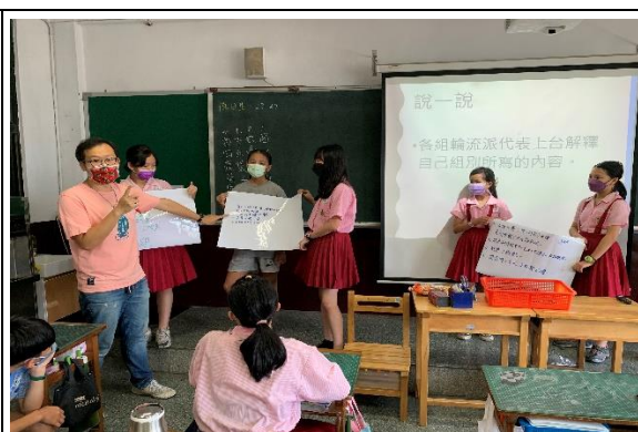
學生輪流進行口語評量(互評)

(五) 試教對象在於教學活動進行前，對於自己性別平等的意識都相當具有信心，因為在以往的課程當中，學生認為了解性別平等的意思就覺得自己完全懂了！但實際對於自身所存在的性別刻板印象與成因，缺乏省思與覺察，也因而阻礙了具體的實踐，這個部分在第一節課特別明顯，所以