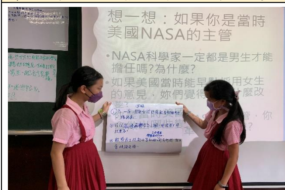
上臺發表-NASA 主管換你做的想法