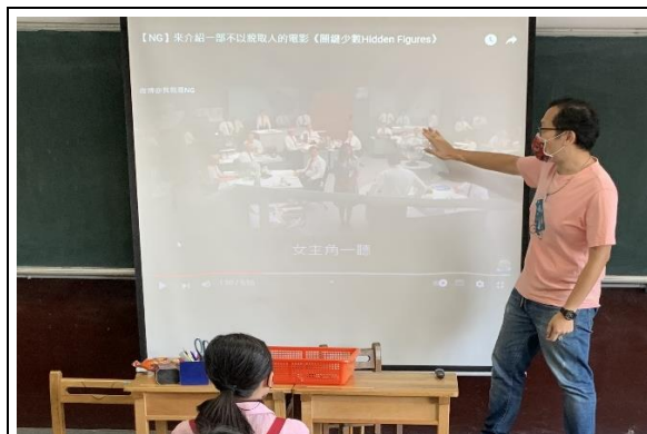
靜態場景觀察需教學者提供鷹架