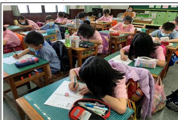
試教對象皆進行學習單評量

(四) 運用多元化的評量方式 (含口語評量、實作評量與學習單評量)，能兼具總結性與形成性評量的目的， 更能掌握試教學生 在性別平等教育課程的 學習表現和學習內容 。