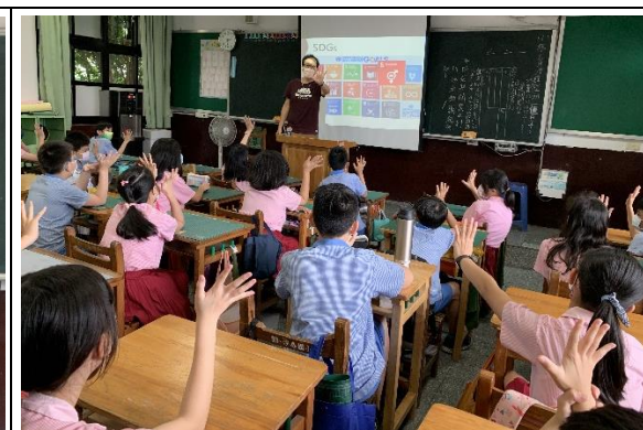
學生對 SDGs-5 都能有基本瞭解