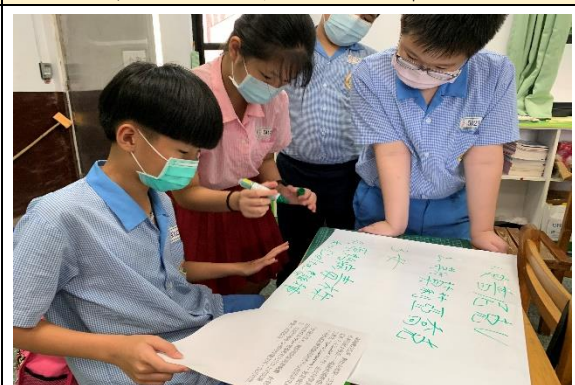
文本閱讀-歸納女性疫苗貢獻資訊

(四) 運用多元化的評量方式 (含口語評量、實作評量與學習單評量)，能兼具總結性與形成性評量的目的， 更能掌握試教學生 在性別平等教育課程的 學習表現和學習內容 。