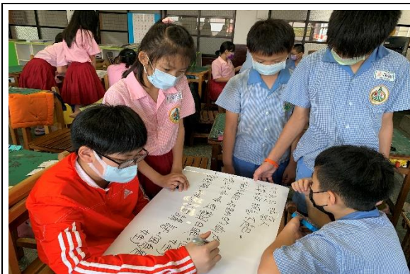
彙整關鍵少數影片男女不平之處

(三) 本次試教 透過異質分組 ，促進小組互助的學習氛圍，藉由 小組合作學習 ，讓試教對象們在於討論與報告過程，皆能相當投入與熱烈。