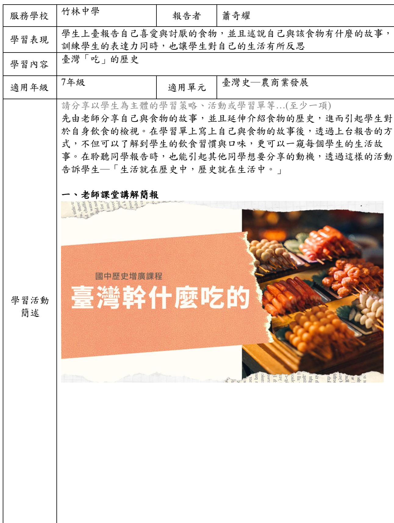
111學年度國中社會領域分區輔導「素養導向教學案例分享」表