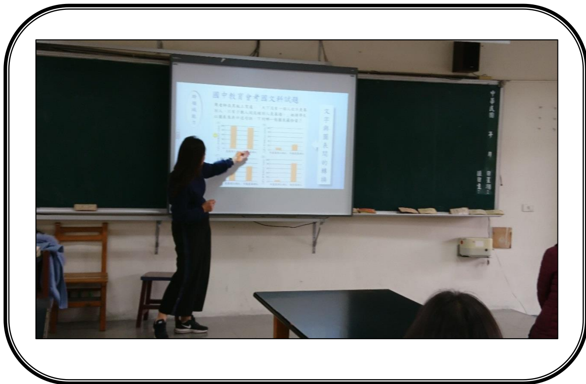
✿* 活動說明：素養導向評量舉隅~國中會考題例說明