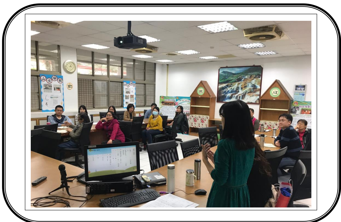
✿✿ 活動說明：題例舉隅~寫作題型分析