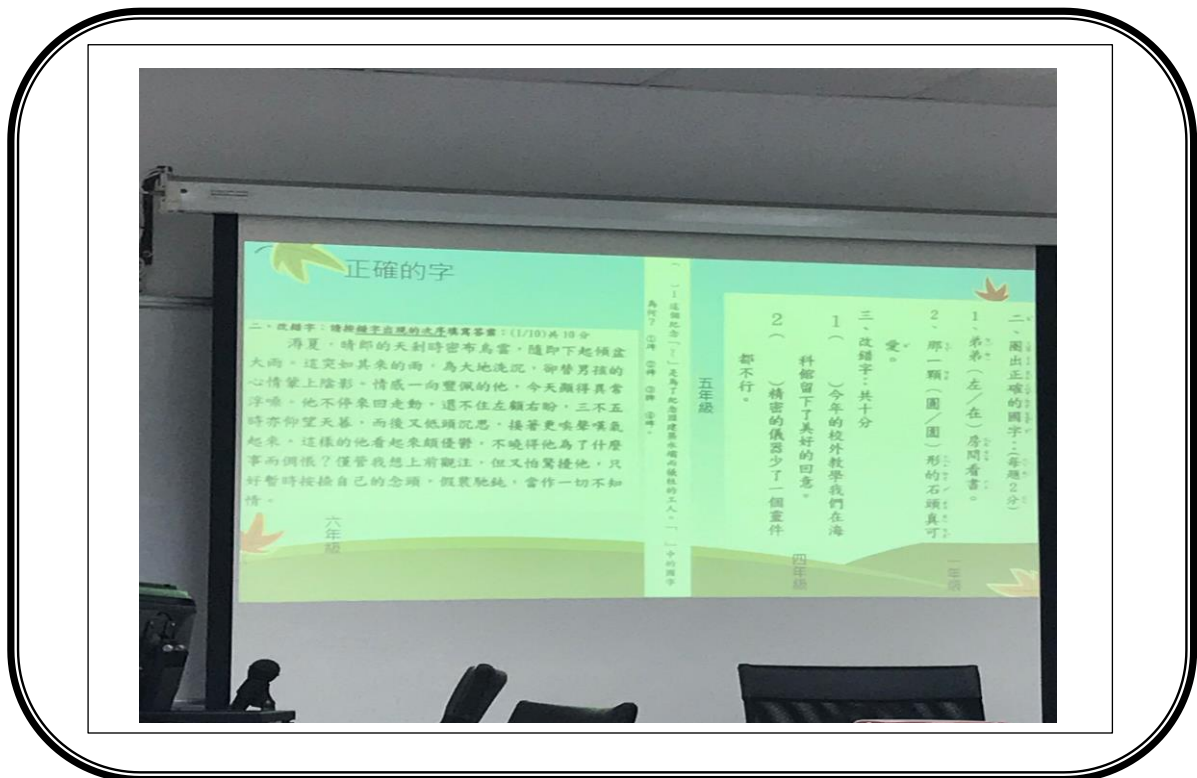
✿✿ 活動說明：題例舉隅~分析山佳國小 107 上學期期末試題