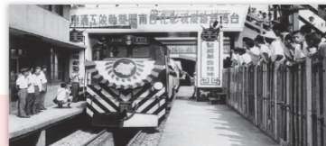
▲早期彰化和臺南間雙向鐵路完工通車的老照片。在鐵路完工後，火車的班次和載客量增加，促進了家鄉交通的發展。（彰化縣）

家鄉的先民，留下了許多歷史文物，有圖書、繪畫、服飾、器物與歌謠等，這些都是家鄉珍貴的資產。透過這些歷史文物，可以幫助我們認識先民的智慧與家鄉的歷史。