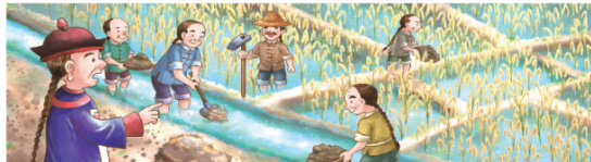
▲張達京帶領人們開發臺灣中部一帶，將當地開墾成一片良田。