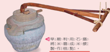
▲早期利用石磨將米磨成米漿製作糕點。