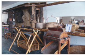
▲家鄉早期常見的生活器物。

每個人的家鄉，都有許多人物、故事和各種文物。這些人物、故事和文物，可以讓我們知道先民的生活情景，還有家鄉的歷史。