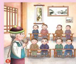
1 陳維英出生於西元1811年，他的父親是當時臺灣著名的富商，深知教育的重要性，於是在家裡設立學堂，聘請老師教導子孫及家鄉人士。