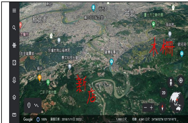
圖一：臺北盆地南邊地形圖(Google earth)