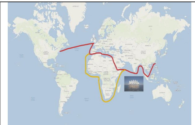
圖二：航線圖(以 Map Tiler 繪製)

第一題：參考圖一，請問陶德到台灣後，發現北部的自然環境可以種植什麼植物？為什麼他覺得可以成功？