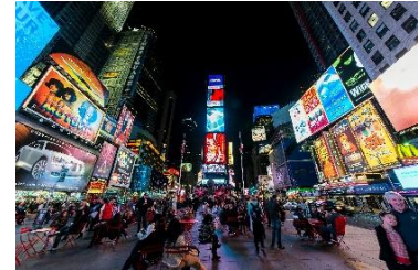
C: Time square