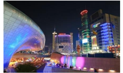
C: Dongdaemun Design Plaza