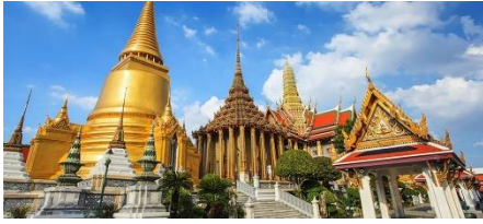
A: Temple of the Emerald Buddha 玉佛寺