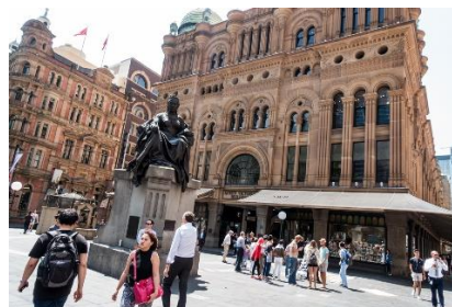
B:George Street 喬治街