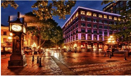
A: Gastown 左邊 Steam Clock 蒸汽鐘