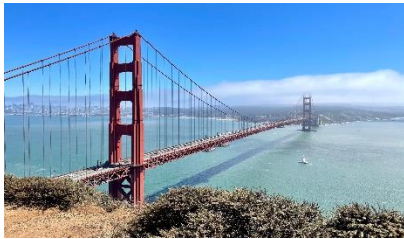
A: Golden Gate Bridge 金門大橋