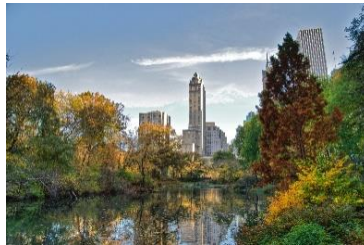
B: Central Park