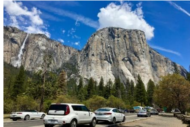
B:Yosemite National Park 優勝美地國家公園