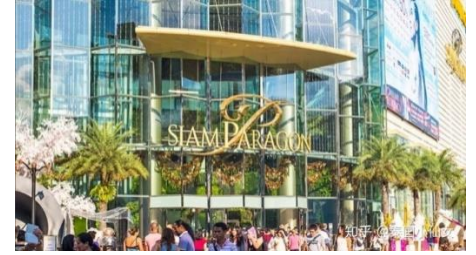
C: Siam Paragon 百麗宮購物中心