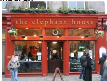
B: The elephant house