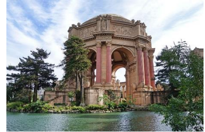
C: the Palace of Fine Arts 藝術宮