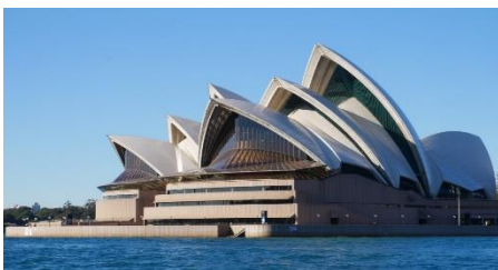
A: Sydney Opera House 雪梨歌劇院