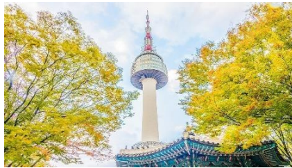
B: N Seoul Tower