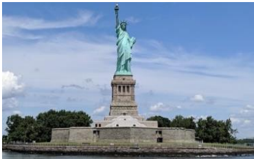
A: Statue of liberty