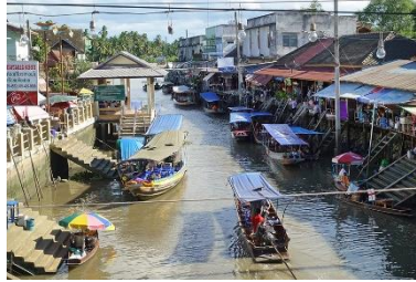
B:Anphawa Floating Market 安帕瓦水上市集