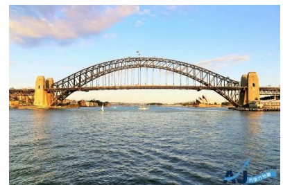
C: Sydney Harbour Bridge 港灣大橋