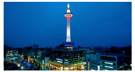
C: Kyoto Tower