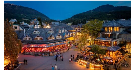
C: Whistler Blackcomb 惠斯勒黑梳山滑雪場