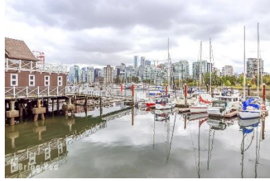
B: Stanley Park 史丹利公園