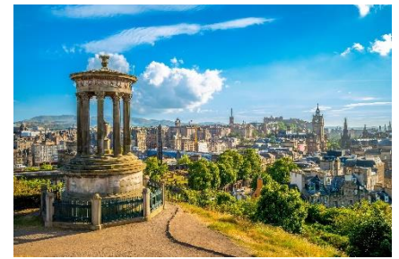
C: Calton hill