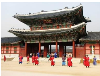
A: Gyeongbokgung Palace