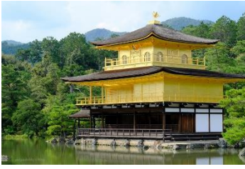
A: Kinkaku-ji Temple