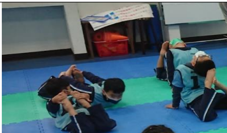
學生模仿、描述動作技能