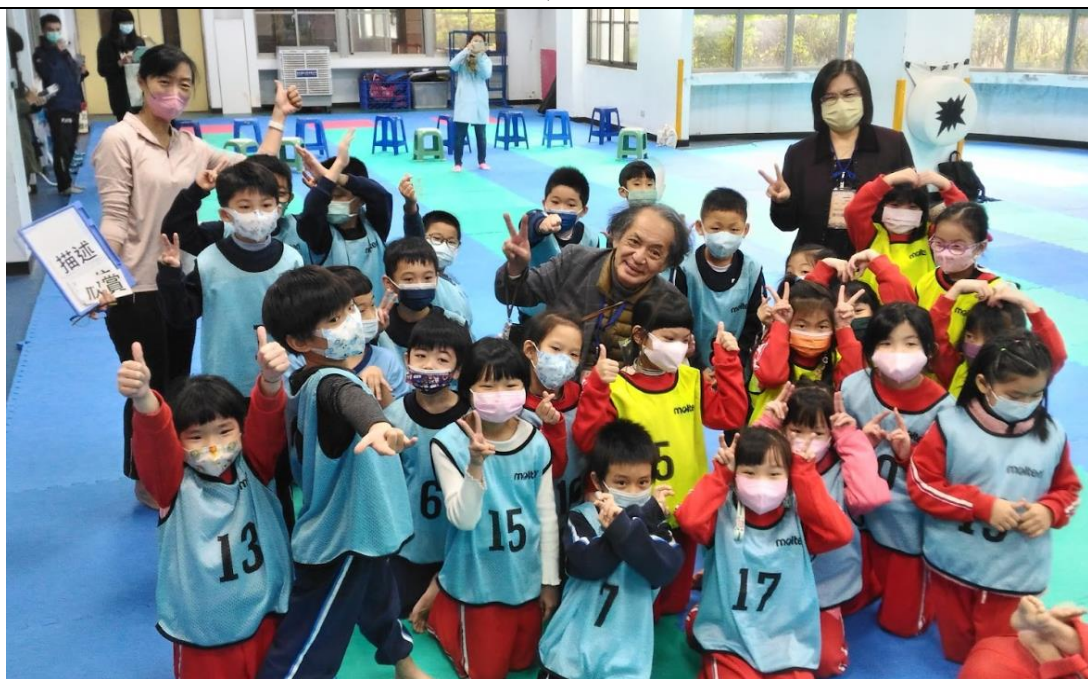
師生與佐藤學合影