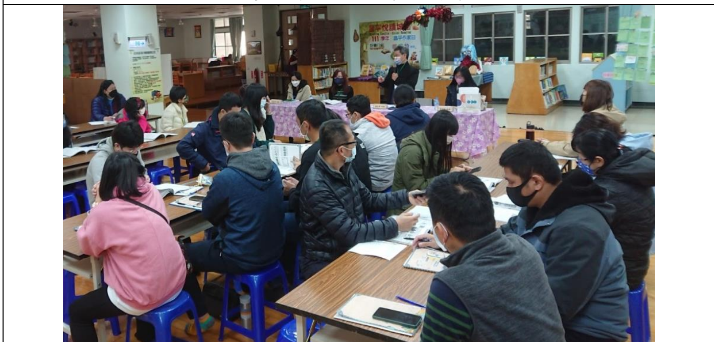
玉疊校長主持觀課前說課