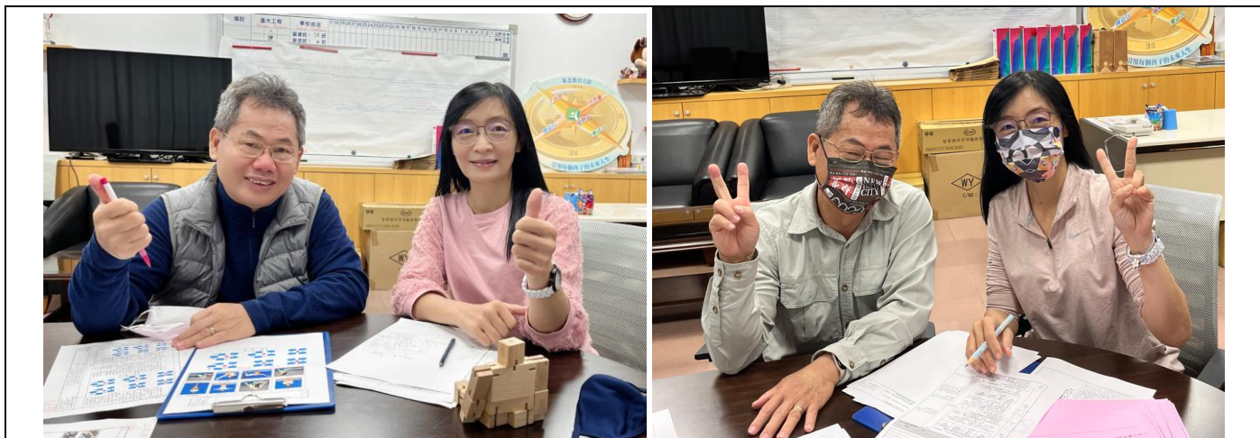
玉疊校長兩次陪伴共備課程