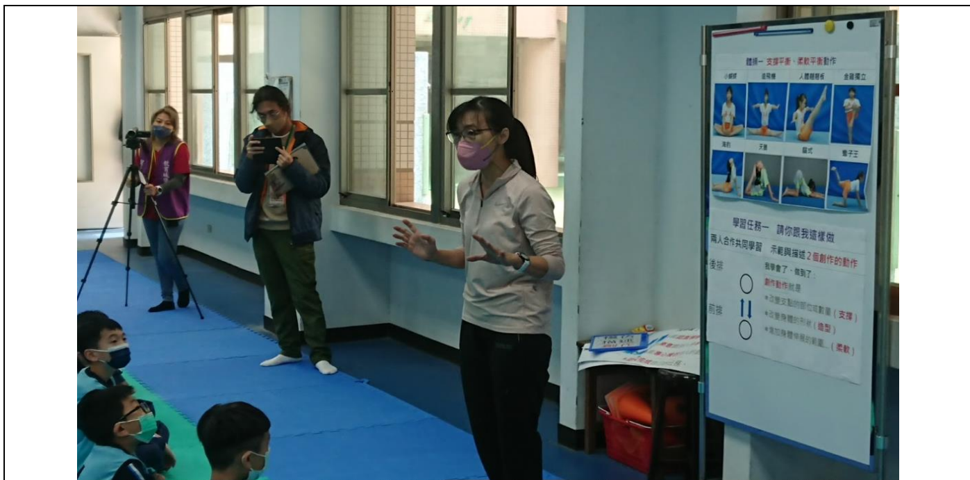
教師說明學習任務一