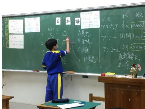
學生上台書寫答案