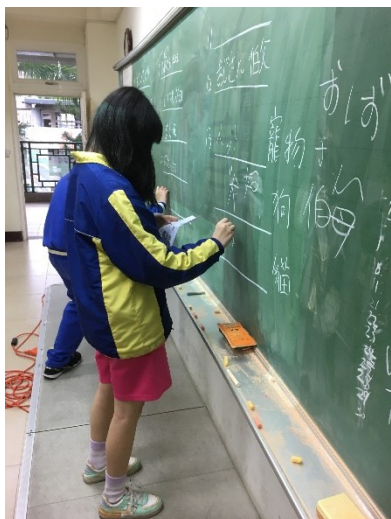
學生上台書寫答案