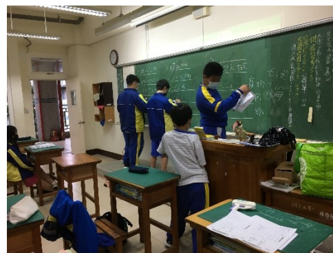
學生上台書寫答案