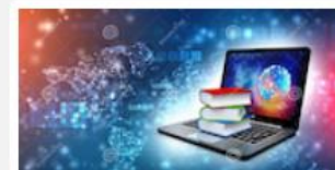
國立臺灣圖書館雲端閱讀