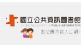
國立公共資訊圖書館電子書