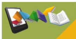
多媒體翻頁電子書