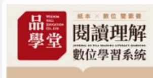
閱讀理解數位學習系統