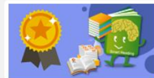
適性閱讀系統（限合作學校）