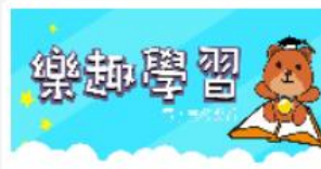
新北市教育局電子書