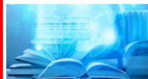
國立臺灣圖書館電子資源