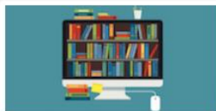
新北市立圖書館電子資源