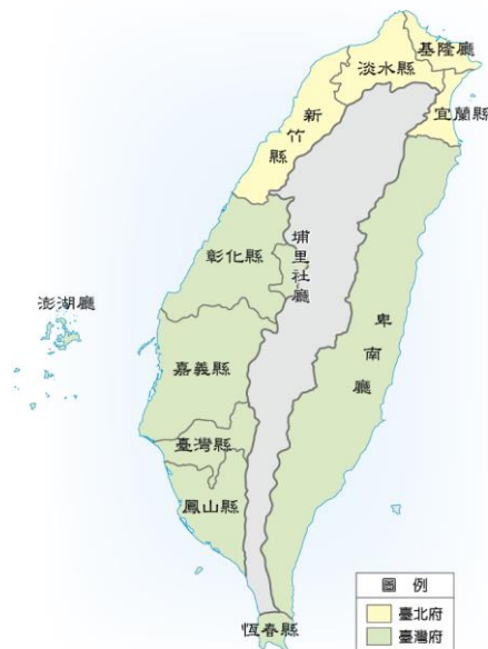
▲2-6-16 光緒元年 (西元 1875 年) 臺灣行政區劃圖

↓2-6-17 沈葆楨 與 丁日昌 在 臺 建設示意圖。圖中除電報線，其他都是 沈葆楨 的建設。