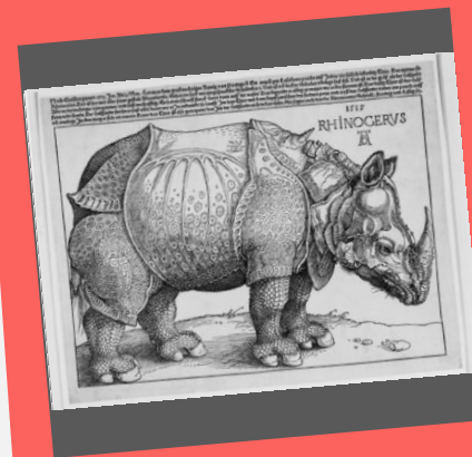
畫作簽名- 資訊隱私