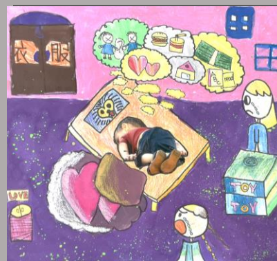
親吻沙灘的小孩- 戰爭、難民