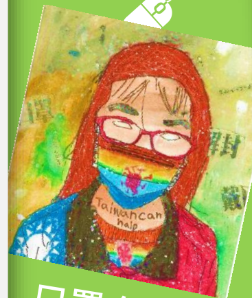
口罩自畫像- 人權與疫情