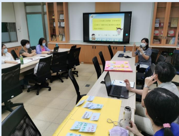
11/19 三鶯區 分區輔導, 參 與人數: 29