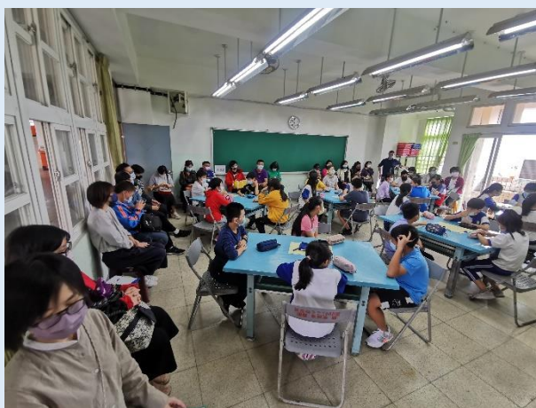
11/24 新興國 小到校輔導 (線上研習), 參與人數: 107