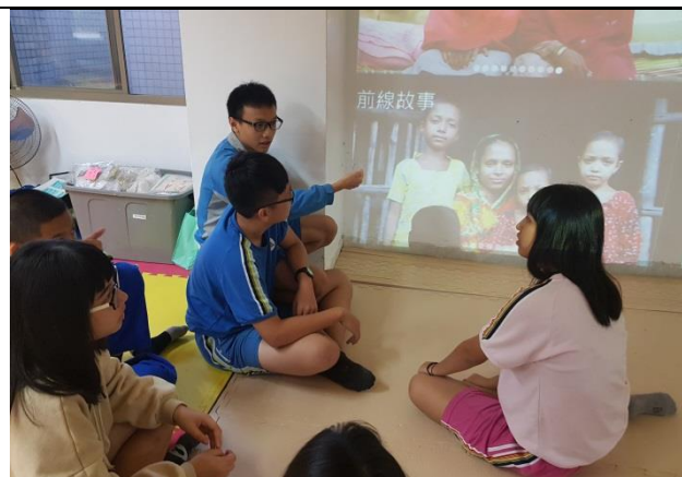
看圖說故事，這些人到底是誰？發生什麼事？