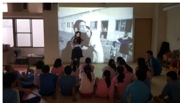
這不是女性議題，而是人權議題