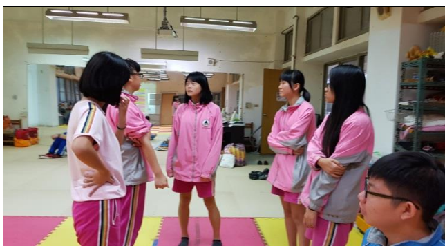
人在天秤上，真的有高低之分嗎？