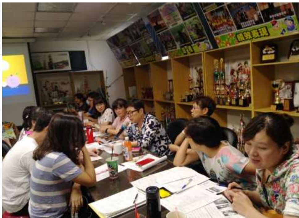
❁❁ 活動說明：議課～教師分享觀課所得