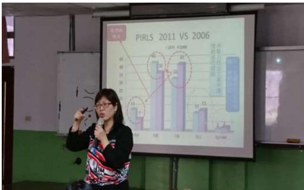
❁❁ 活動說明：命題評量實務 4—PIRLS 成績分析