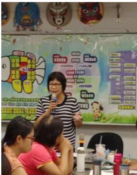
❁❁ 活動說明：美雲校長和惠花校長評課