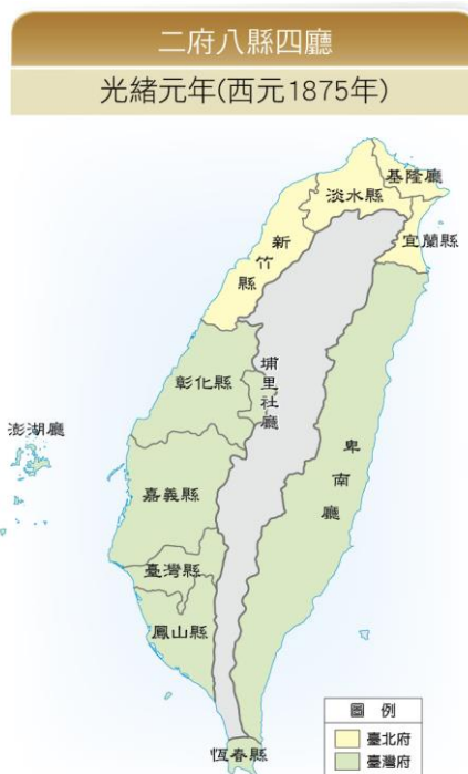
▲2-6-16 光緒元年 (西元 1875 年) 臺灣行政區劃圖

丁日昌繼 沈葆楨 之後來臺，他嚴懲貪官汙吏、招民移墾東部，並持續推展對臺建設，架設臺灣府城至 安平 、 旗後 的電報線(2-6-17)，成為臺灣最早的電報線。