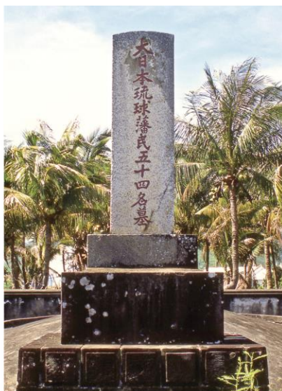
↑2-6-13 屏東縣 車城鄉的琉球難民墓。這是日治時期日本人為罹難琉球人設立的墓碑，碑文為「大日本琉球藩民五十四名墓」，藉此確認琉球人為日本臣民。