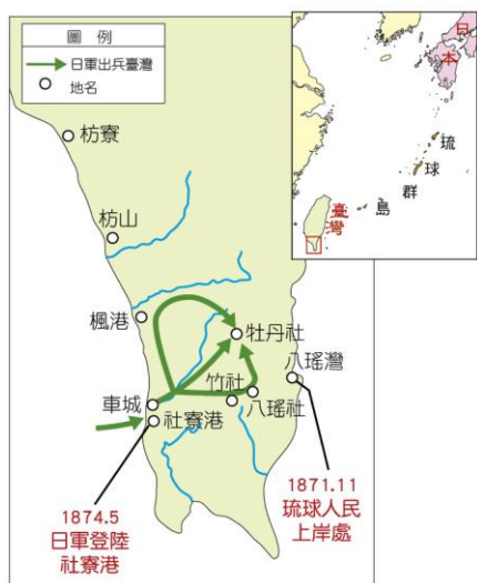
↑2-6-12 日本出兵臺灣示意圖