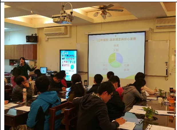
1123 分區輔導林美玲主講環教 12 年課網融入教學示範