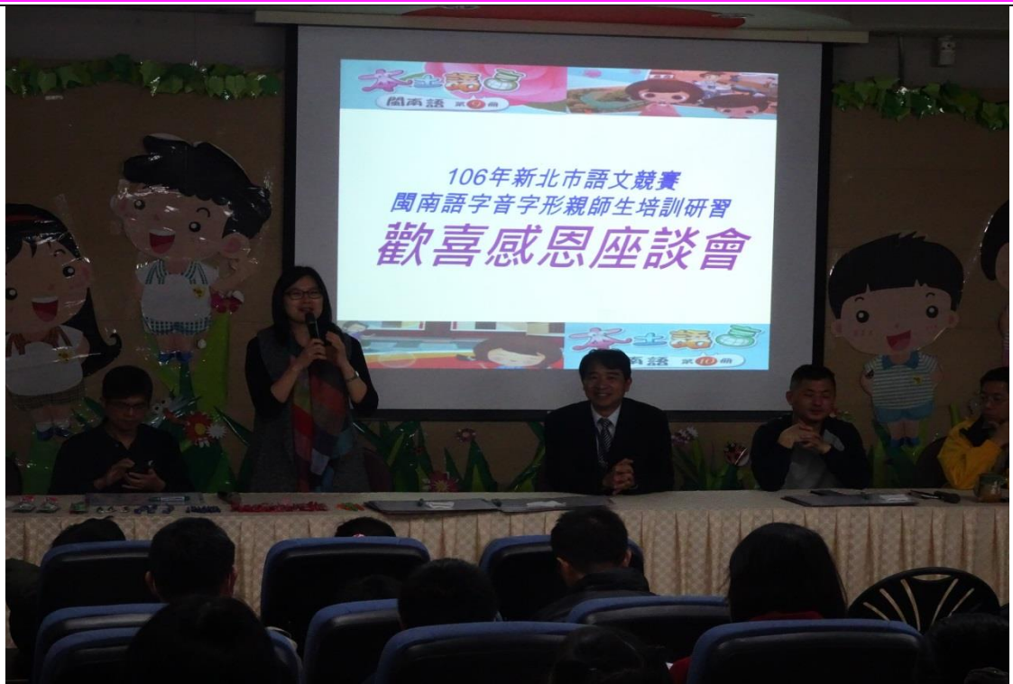
課程統整與成果發表-歡樂感恩座談會