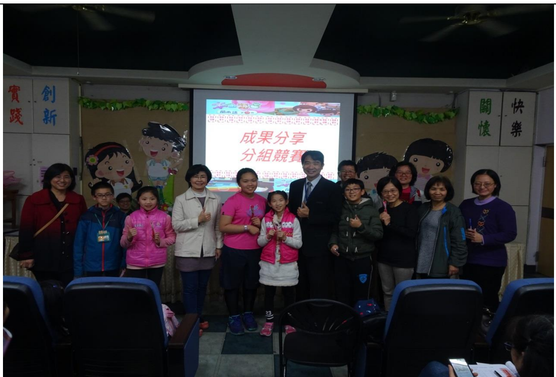
成果分享-學員分組競賽合照留念