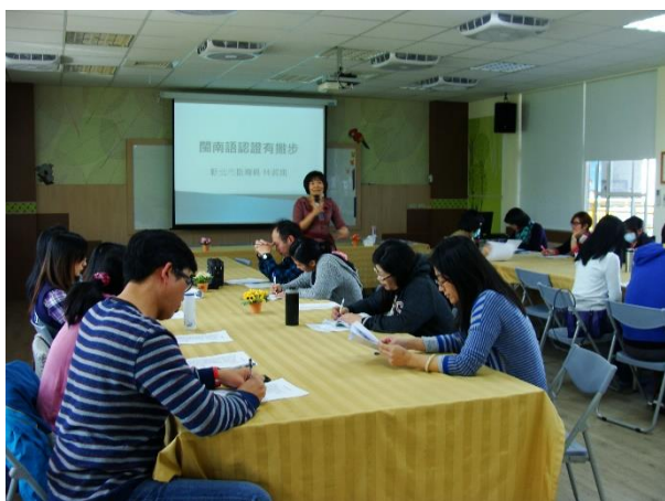
辦理到校輔導－閩南語認證有撇步