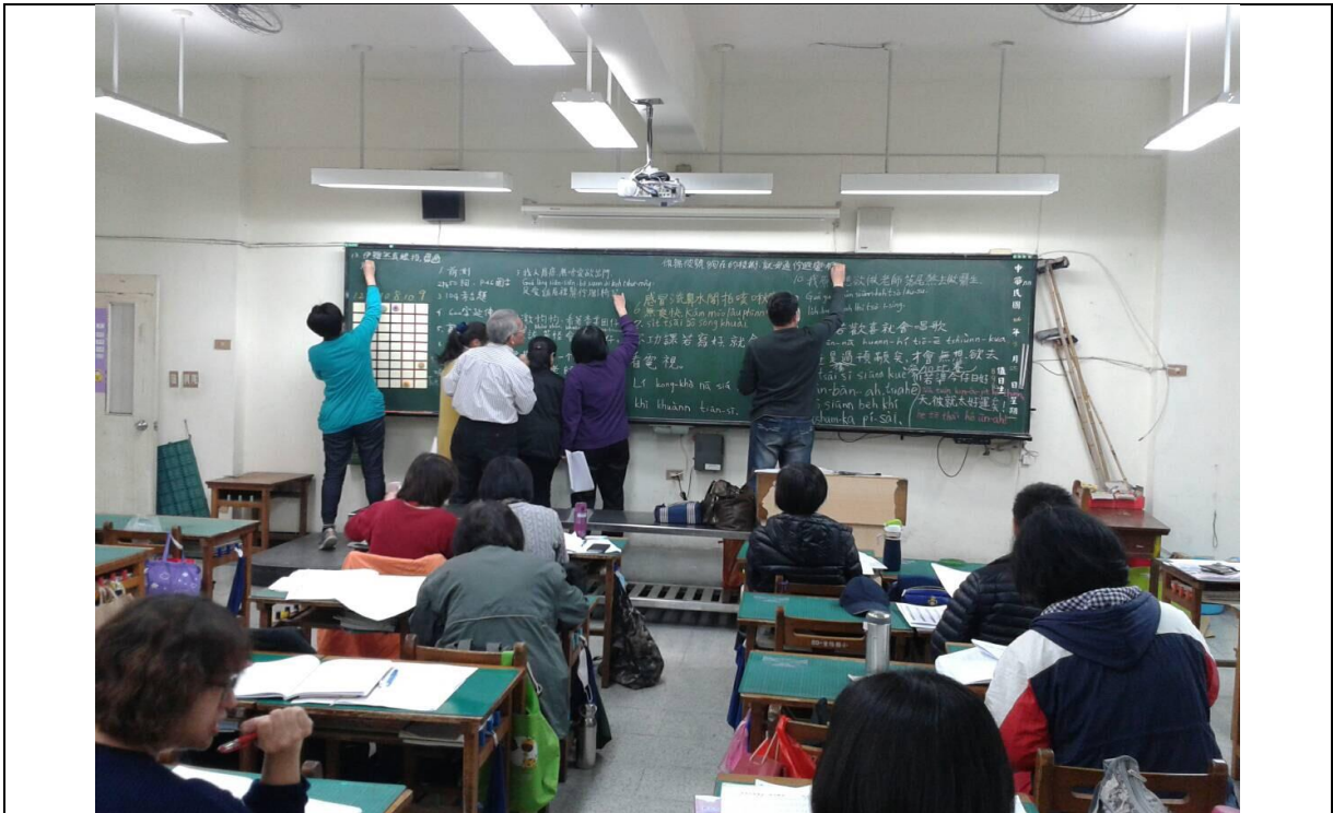
字音字形分組實務演練-學員上台練習拼音書寫