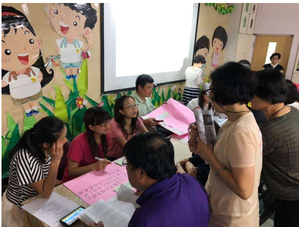
十二年國教教學示例書寫實作-學員分組討論