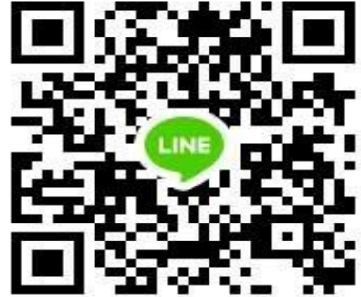
三重新莊淡水分區

小提醒: 請加入群組的老師，不要把「網址-行動條碼」的選項取消，因為會造成其他老師無法加入，謝謝喔!!