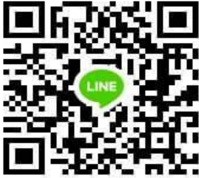
七星雙和文山分區