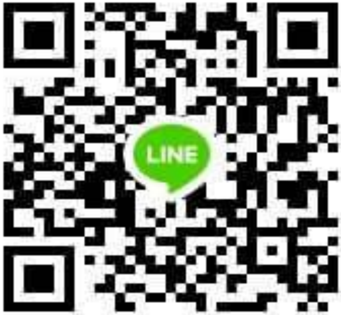
瑞芳板橋三鶯分區