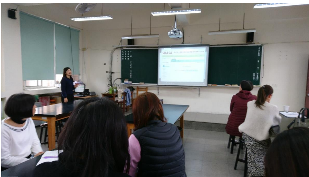
✿✿ 活動說明：素養導向標準本位評量~網站資訊介紹分享