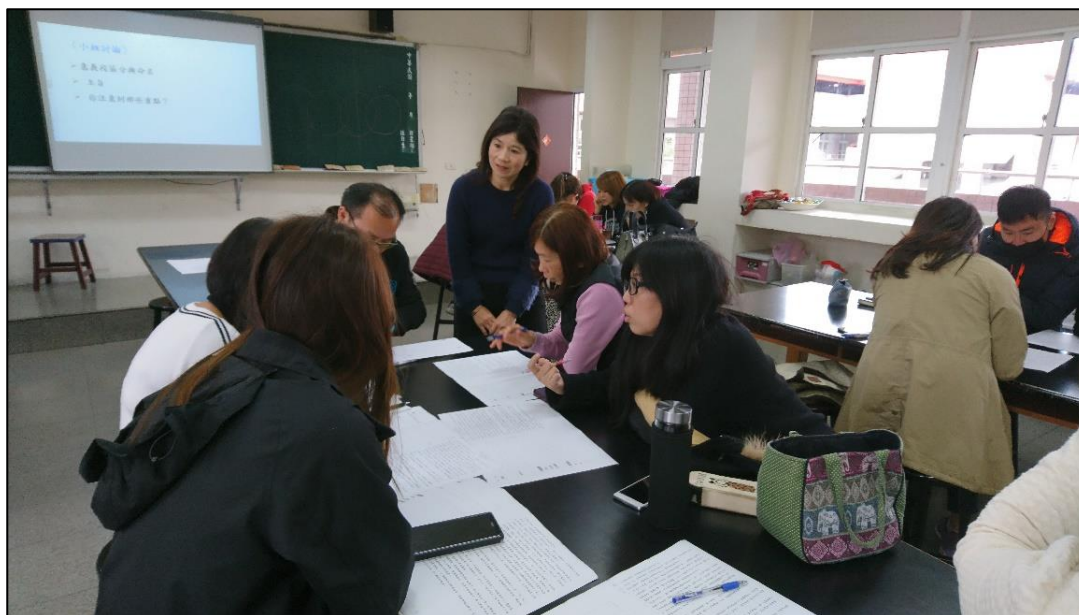
✿✿ 活動說明：素養導向評量實作練習~智救養馬人