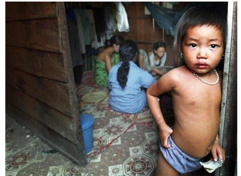
雛妓在午間休息、玩牌消磨時間，準備晚間接客。（美聯社）

過去數十年，斯維帕克與柬埔寨其他地區因人口販運而惡名昭彰，狹窄巷弄內的妓院中，不只有當地的婦女、少女、女童被迫以低廉的價格接客，更有許多處於柬埔寨社會邊緣的越南女性與女孩也在簡陋的隔間和床板間受苦。