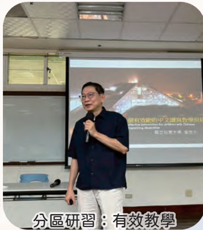
分區研習：有效教學