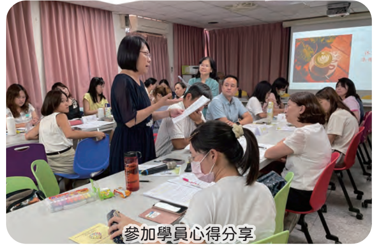
參加學員心得分享