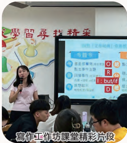
寫作工作坊課堂精彩片段