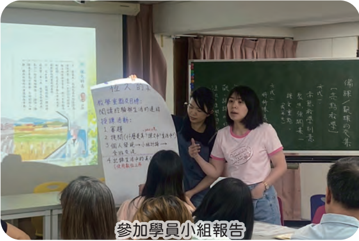
參加學員小組報告

教學目標： 1. 拼讀注音 2. 理解文本疊字 教學步驟： 1. 暖身活動：一閃一閃 2. 知識技能：疊字星星 右閃右閃 語詞詞性 3. 創意朗讀 分部輪讀 4. 參加學員現場產出學習成果