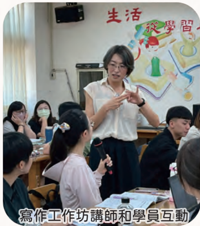
寫作工作坊講師和學員互動