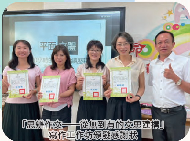
「思辨作文——從無到有的文思建構」 寫作工作坊頒發感謝狀