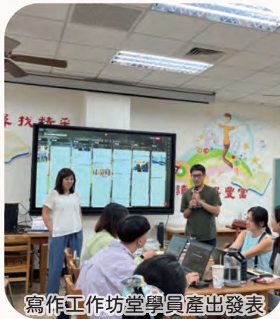
寫作工作坊堂學員產出發表