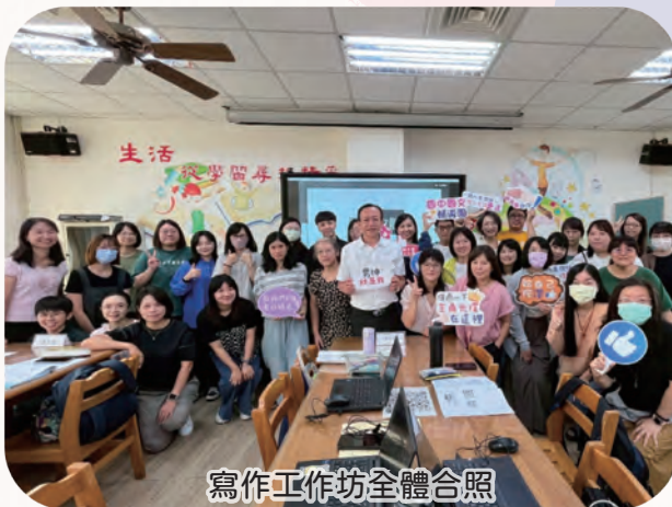
寫作工作坊全體合照